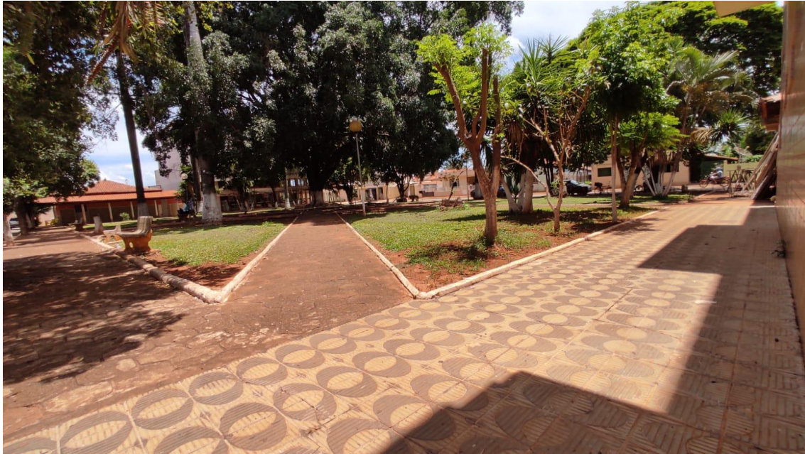
Praça Farmacêutico Manoel Ferreira.