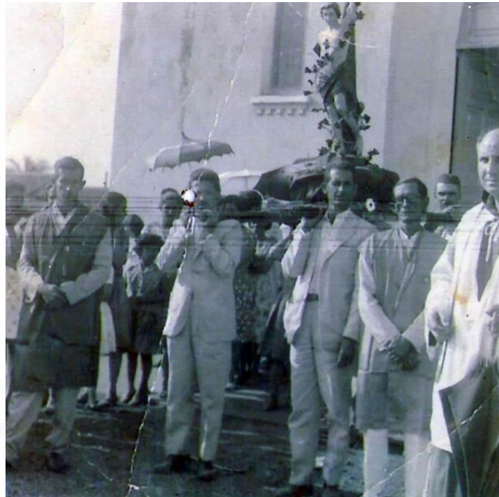
Procissão de São Sebastião, na Praça da Matriz, atual Praça Farmacêutico Manoel Ferreira. Foto Arquivo da Prefeitura, datada da década de 1950