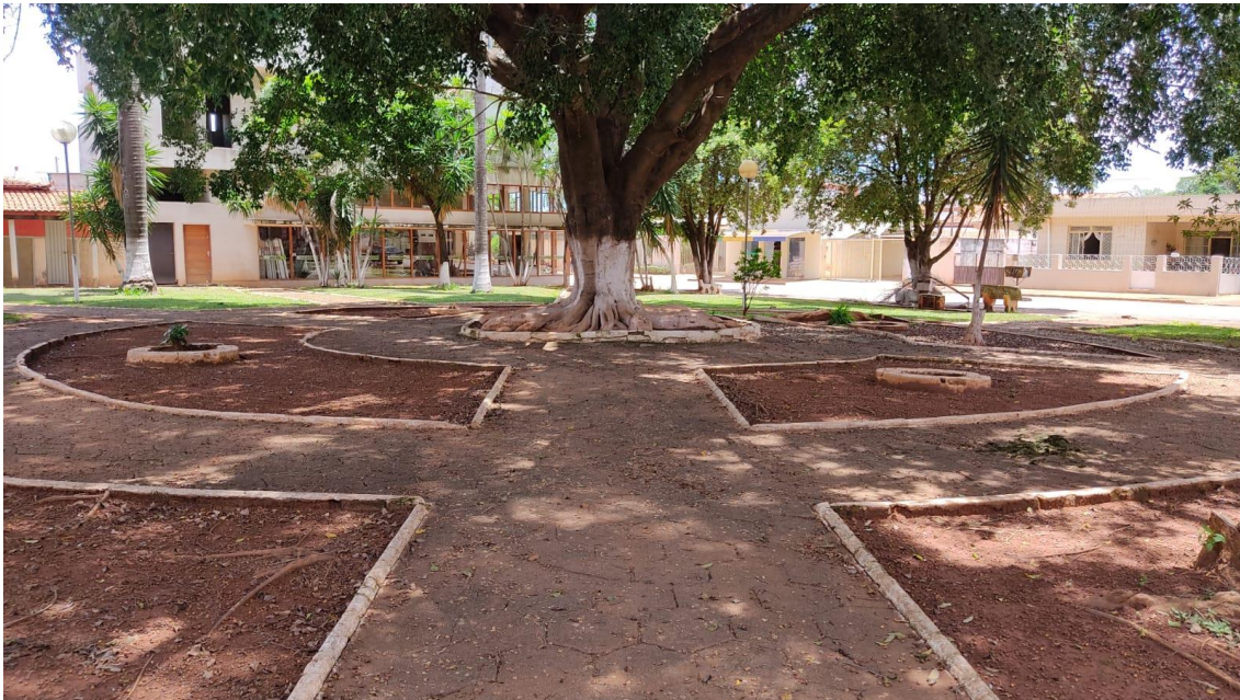
Praça Farmacêutico Manoel Ferreira.