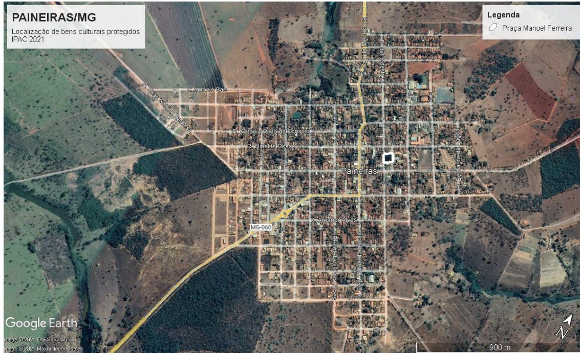
Bem cultural inventariado. Imagem extraída do Google Earth em nov/2021.