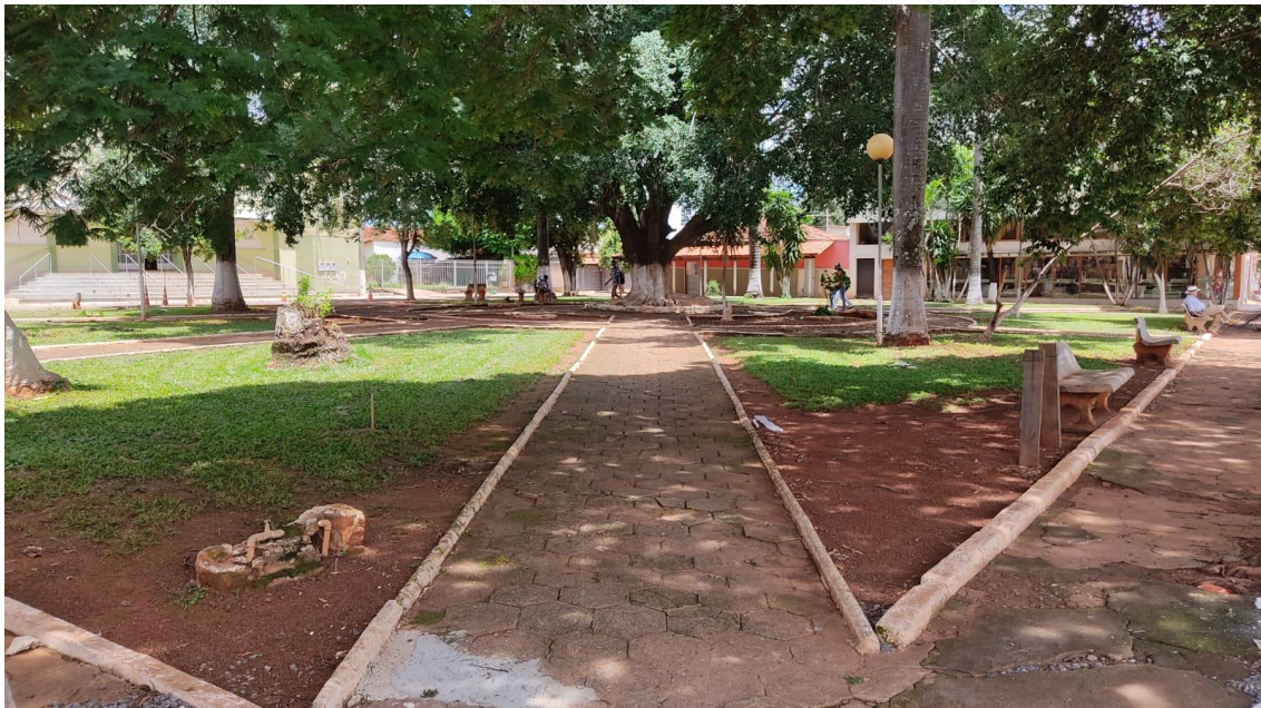
Praça Farmacêutico Manoel Ferreira.