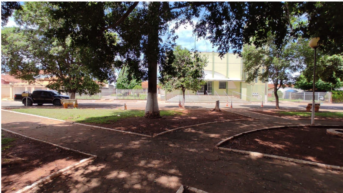
Praça Farmacêutico Manoel Ferreira.