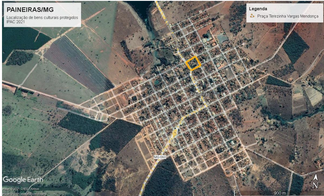
Bem cultural inventariado.